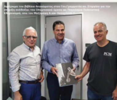
Αφιέρωση στον Γεν. Γραμματέα Στεργίου Πώργο.